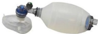
リユーズブル蘇生バ ッグ(成人用)...