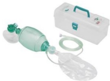
ディスポ蘇生バッグ D-14(成人用...)