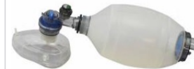
リユーズブル蘇生バ ッグ(成人用)...