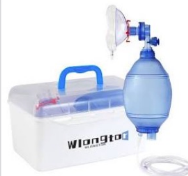
Anasgo PVC Ambu BVMバッグ、MPR...