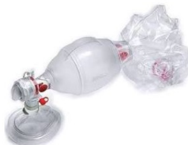
アンプ蘇生バッグ SPUR(ディスポタ...)